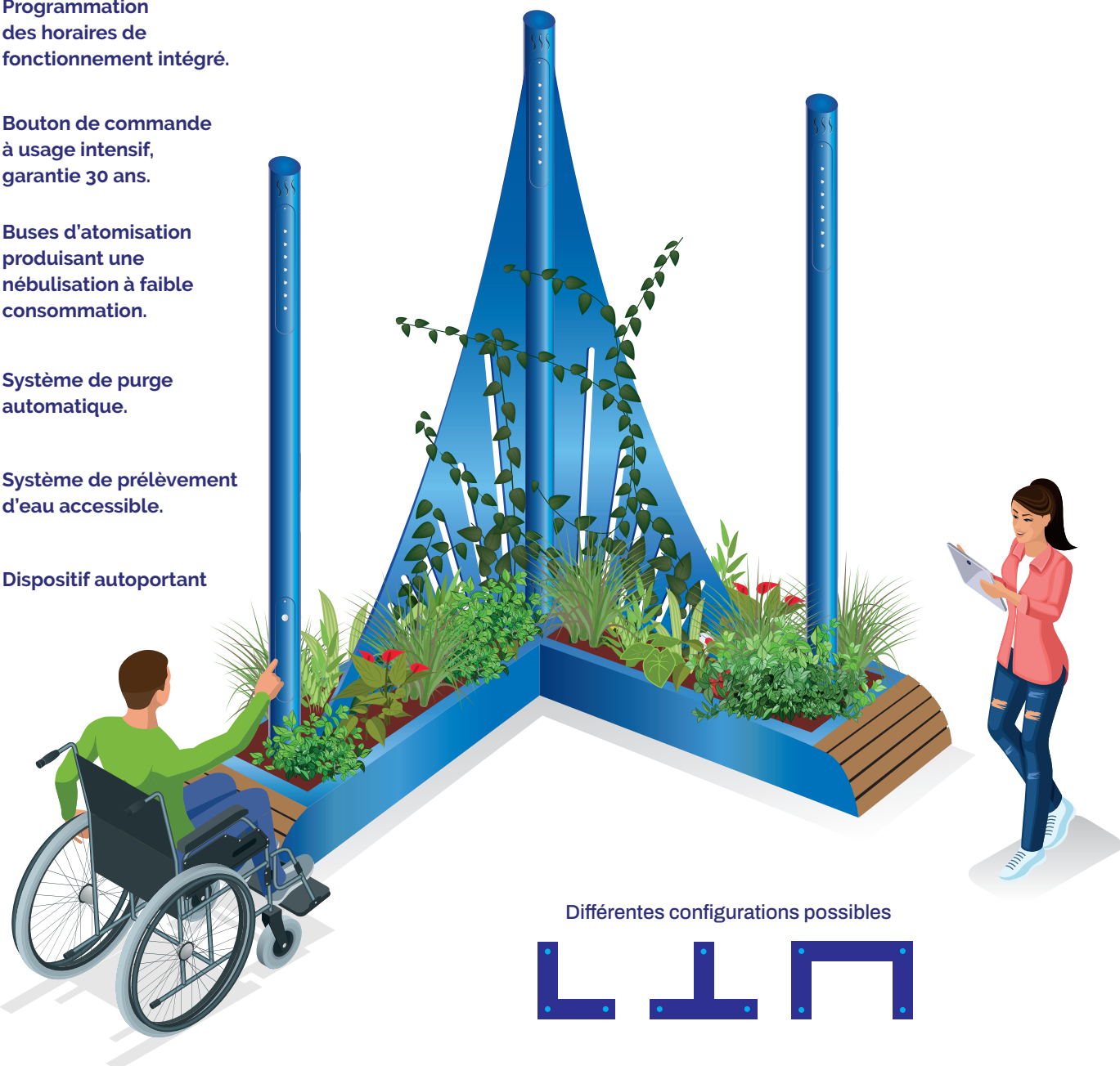
Différentes configurations possibles